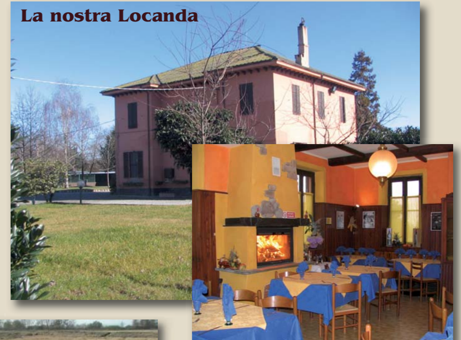
La nostra Locanda

Possibilità di cacciare all'interno dell'azienda tutto il giorno anche in 4 fucili.